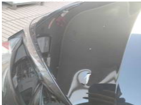
Phare avant droit (Rayure)